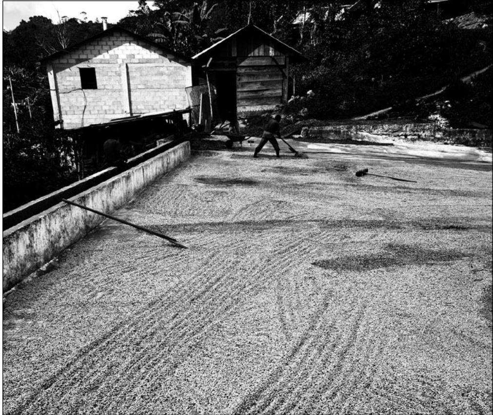
Kaffeböner på tork på kaffekooperativet Comon Calebals i Guatemala.

ducentens kapacitet, om produkten är ekologisk eller inte, hur bra producenten är på att förhandla, vilken relation man har till sina uppköpare, efterfrågan och givetvis vilken strategi som uppköparen har.