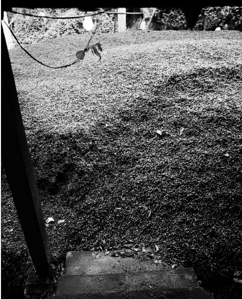
Tomma skal från kaffebönor på kaffekooperativet Comon Calebals i Guatemala. Skalen från bönorna blir sedan gödningsmedel.

till exempel, har därför skapat sina egna märkningar för att försöka radera den bilden och försöker nu konkurrera med Rättvisemärkt och ekologiskt kaffe.